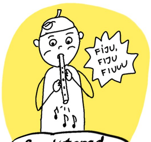
Pan listopad gra na flecie, fiju, fiju, fiu.