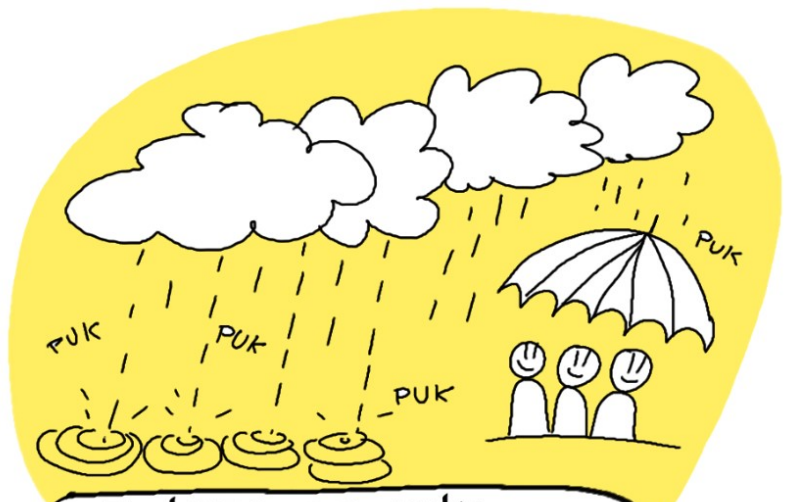
Z deszczem puka równo, pięknie koncert daje nam.