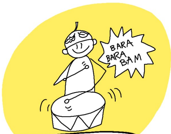
Pan listopad gra na bębnie BARA, BARA, BAM!