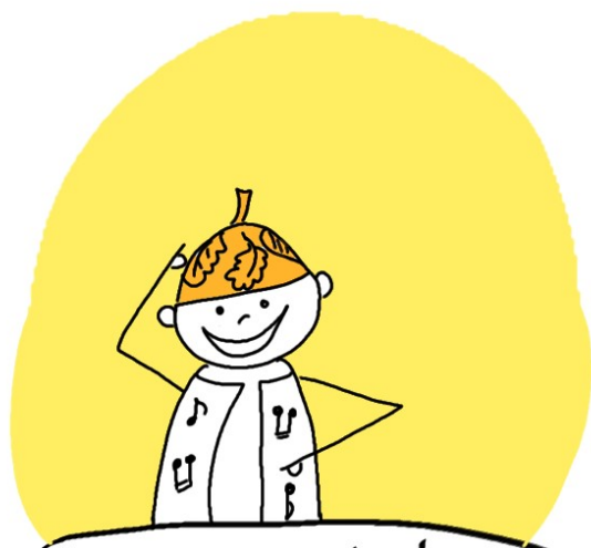
Z liści złotych ma berecik, a kubraczek z nut